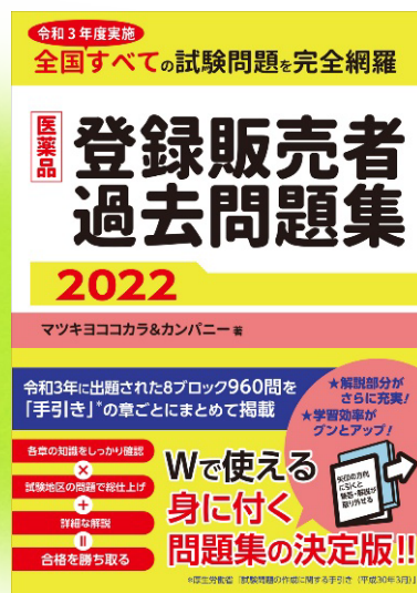
医薬品登録販売者過去問題集 2022

「未来の常識を創り出し、人々の生活を変えていく」をグループ理念に掲げ、全国に3,300店舗超のドラッグストア・調剤薬局を展開する株式会社マツキヨココカラ&カンパニー（本社：東京都文京区、代表取締役社長：松本清雄、以下 マツキヨココカラ&カンパニー）は、医薬品登録販売者資格取得に向け、2021年度に全国で出題された問題（960問）を完全収録した「医薬品登録販売者過去問題集 2022」を、2022年3月18日より全国の書店、オンラインストアで順次販売を開始いたします。充実した詳しい解説付きで、「合格力」を徹底的に高める学習ツールとなっております。