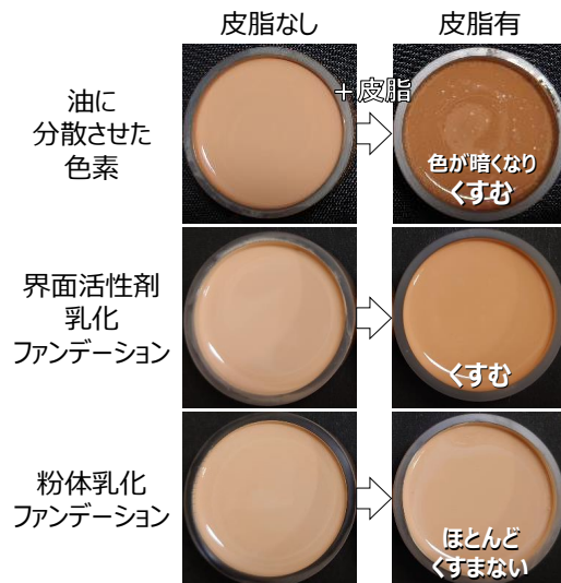
図1. 皮脂による色素のくすみ(皮脂くすみ)

各サンプルに人工皮脂※3を混合し色を確認 ※3 トリオレイン、ミスチン酸オクチルドデシル、オレイン酸、スクアレンの混合物