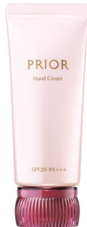
プリオール おしろい美肌 ハンドクリーム