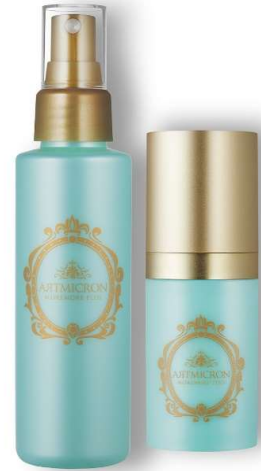
アートミクロン モアモアプラス (左)スプレー、(右)パウダー

鏡などでつむじの位置を確認したら、パフをあてて円を描くように中心から外側へポンポンとパウダーをのせていきます。空気を含んだ髪をつぶさないように、つむじを中心にスプレーします。