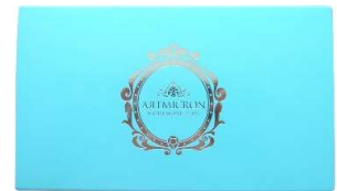
外箱も爽やかにリニューアル