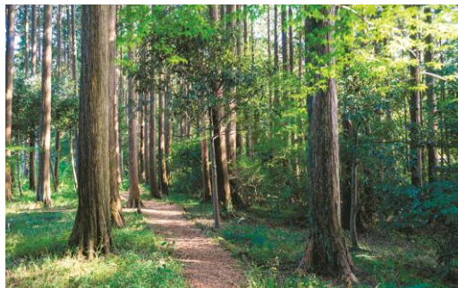
ひのき(写真はイメージ)

古くから抗菌・消臭作用を持つことで知られているひのき。江戸時代から保護管理されてきた長野県木曽地域に自生の樹齢約300年以上の木曽ひのきは「伊勢神宮の用材」にも選ばれている特別な存在。その枝や葉を有効利用して抽出された天然純度100%の精油です。