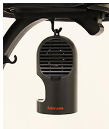
プラズマクラスターイオン発生機

ウィッグをケースに保管し、プラズマクラスターイオン発生機を運転させることで、タバコ臭 ※2 や汗臭 ※3 を消臭。また、プラズマクラスターイオンは静電気を抑制できるため、静電気によってついたウィッグ表面の付着物を取り除きやすくします ※4 。