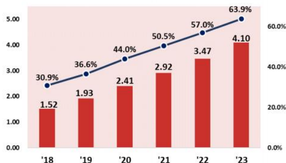
図表 7-13：中国のBtoC-EC市場規模とEC化率の拡大予測（単位：兆USドル）

近年、中国EC市場は著しく成長し、2020年予測では市場規模2.41兆USドル（約256兆円）に達するとも予測されています（※1）。そして、ここ数年でその成長に欠かせない存在になりつつあるのがライブコマース（ライブ配信による商品販売）です。2019年は約6兆5,000億円だった市場規模が、2020年には約14兆4,150億円と、1年で約2.2倍に拡大すると予測されています（※2）。