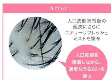
人工皮脂塗布後の頭皮にさらにエアリーフレッシュミストを塗布