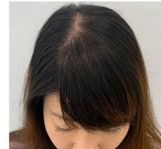
After 人工皮脂塗布後の前髪にさらにエアリーフレッシュミストを塗布