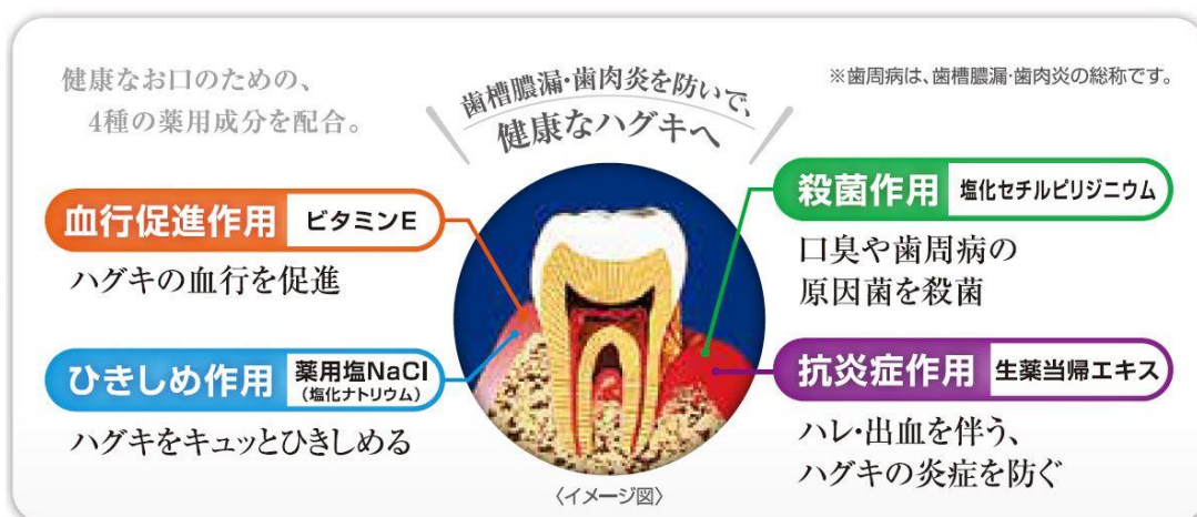
図2 歯槽膿漏・歯肉炎からお口を守る4つの薬用成分の作用