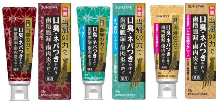
サンスター薬用塩ハミガキ

薬草として広く栽培されるセリ科の多年草です。本品の薬用成分生薬当帰エキスは、その根から抽出した成分で、ハレ・出血を伴うハグキの炎症を防ぐ作用があります。