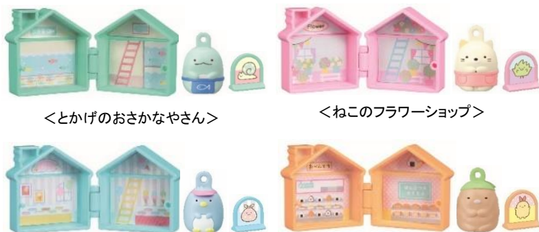
<とかげのおさかなやさん>