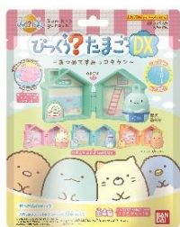
～せっけんのかおり～

子どもたちに大人気な「すみっこぐらし」に登場する人気キャラクターたちのハウス、マスコット、プレートが3点セットになった、DXサイズならではの豪華な仕様です。ハウスは開閉式になっているので、閉じたままマスコットやプレートと並べて飾ったり、広げておみやげやさんごっこをしたりなど、通常の『びっくら?たまご』よりもさらに遊びの幅が広がりました。