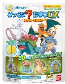
～カモミールのかおり～

フィギュアは『びっくら?たまご』シリーズ史上最大となる約50mmで、サイズの大きなポケモンをラインアップしています。別売りの『びっくら?たまご』のポケモンのフィギュアと一緒に遊ぶと世界がさらに広がります。