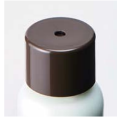
トリートメント容器