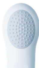
シリコン製のリアヘッド