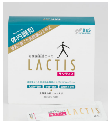
認証取得製品『ラクティス』