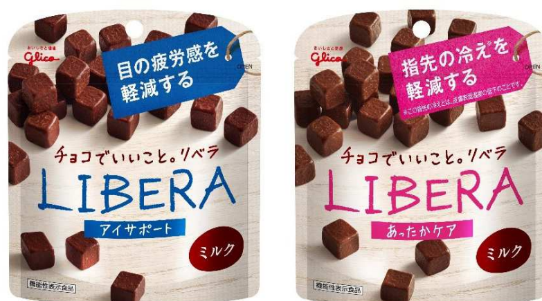
左から: LIBERA アイサポート<ミルク>、LIBERA あったかケア<ミルク>

当社は、これからも「LIBERA」ブランドを通して、お客様に「おいしさと健康」をお届けしてまいります。