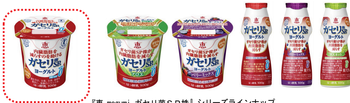
『恵 megumi ガセリ菌SP株』シリーズラインナップ