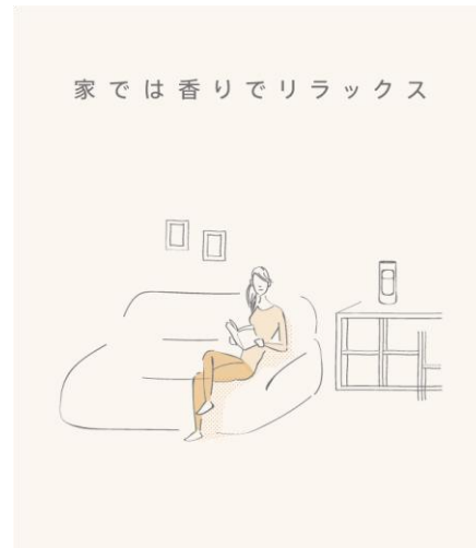
オゾネオ アロマの使用イメージ