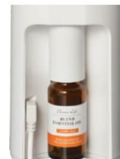
エッセンシャルオイルのセットアップ

対応エッセンシャルオイル(別売)をはめ込むだけの簡単セットアップ。水や熱を使わないので、エッセンシャルオイルそのままの香りが楽しめます。