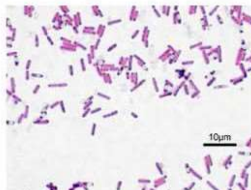
太る細菌:フィルミクテス 学名:Firmicutes

いくら食べても太れない人は、 腸内に「 痩せる細菌 」が 多いことが考えられます。