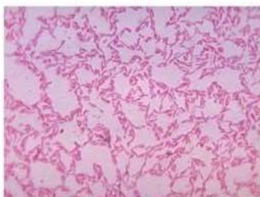
痩せる細菌:バクテロイデス 学名:Bacteroides