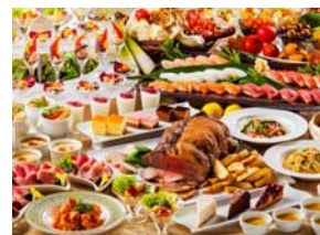
バイキング(イメージ)

◆ご利用施設 東京ベイ舞浜ホテル クラブリゾート セミナー:2階宴会場 撮影会:2階写真室 お食事:3階ダイニングスクエア「ジ・アトリウム」