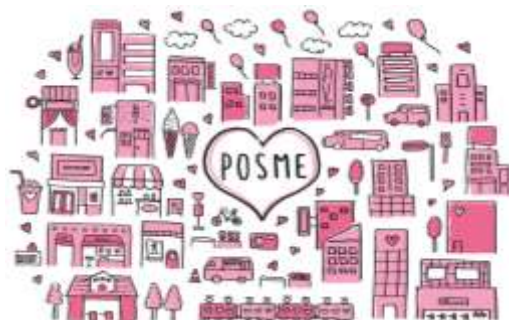
【POSME はさまざまな商品・サービスに展開します】