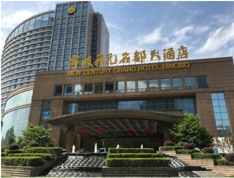
寧波開元名都大酒店外觀