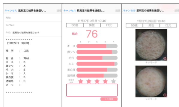
判定結果メールイメージ

6. 撮影した肌画像の特長から、肌ケアプランの説明や、教育用ツールとしても使えるお役立ちコンテンツ「お肌について」を提供