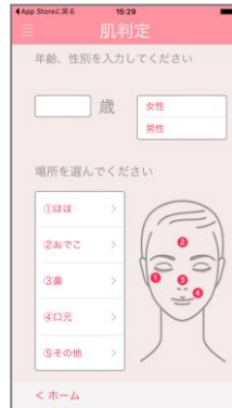
撮影時の入力画面イメージ

*1 肌レンズ「ミモレ」:別売(税込9,800円)。Amazon内 hada more 公式ストアで販売しています。