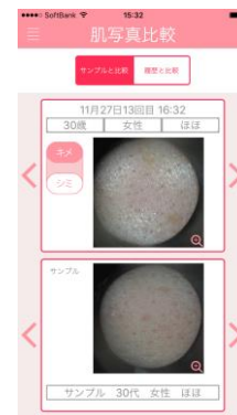
年代別サンプル画像比較イメージ