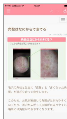
コンテンツのイメージ