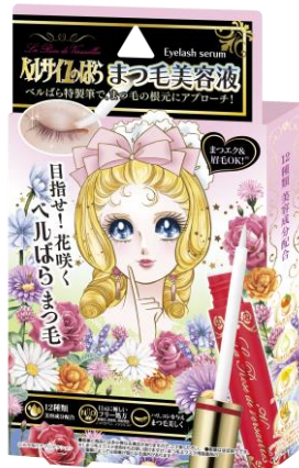
『ベルサイユのばら まつ毛美容液』