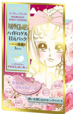
『ベルサイユのばら ハイドロゲル 目元パック』