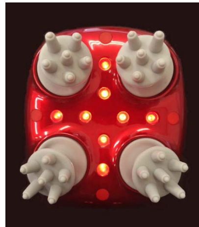
SS レッド LED ビーム発光時