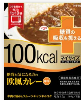
100kcal マイサイズいいね!プラス 糖質が気になる方の欧風カレー