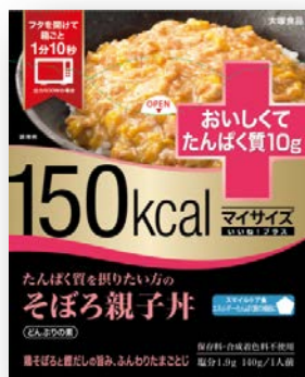
150kcal マイサイズいいね!プラス たんぱく質を摂りたい方のそぼろ親子丼