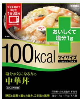
100kcal マイサイズいいね!プラス 塩分が気になる方の中華丼