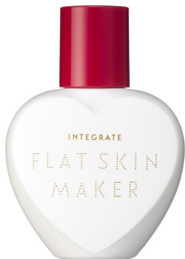
インテグレート フラットスキンメーカー N