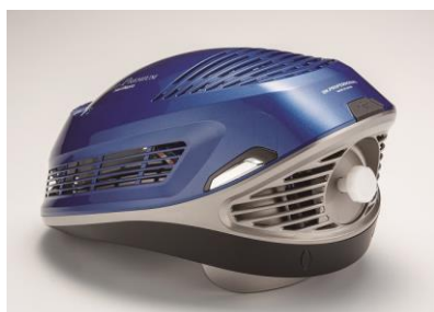
オリエンタルブルー