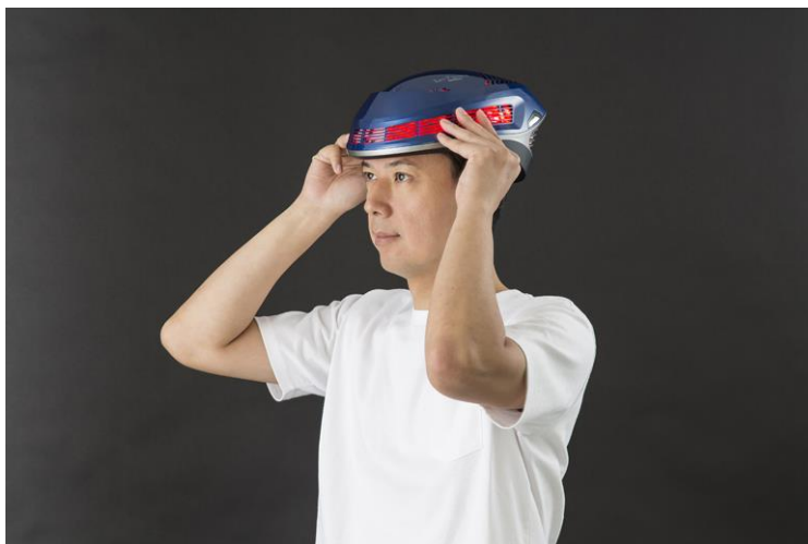
「HairRepro LED Premium」装着時

「HairRepro SCALPAIR」は、1998 年に発売した頭部用空圧マッサージ機「カルフィナ」のリニューアル機で、全 4 通りの空圧パターンを搭載しています。空気の加圧と減圧を繰り返し、頭皮の緊張と緩和を繰り返すことで、人の手では不可能な動きを実現し、頭部全体をマッサージします。また、脚と腕に使用できるフット&アーム用カフ（別売）を使用することで、頭部だけでなく、多用途のリラクゼーションとしても利用できます。