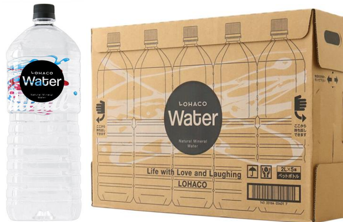
LOHACO オリジナル天然水「LOHACO Water」

アスクル株式会社(本社:東京都江東区、社長:岩田彰一郎、以下アスクル)が、ヤフー株式会社(本社:東京都港区、社長:宮坂学)の協力のもと運営する一般消費者向け(BtoC)インターネット通販サービス「LOHACO」(ロハコ、 http://lohaco.jp/ 、以下 LOHACO)は、LOHACO 初となるオリジナルのペットボトル天然水「LOHACO Water」を5月18日より販売開始しました。