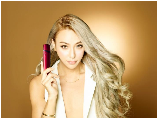
「Beaustage VEGAS Premium」 イメージキャラクター GENKING 氏

毛髪と皮膚は関連性が高いことから、当社では長年、大学やパートナー企業との共同研究などを通じ、スキンケア、ボディケア、ヘルスケアにも着目しておりました。この度、「Beaustage」ブランドの立ち上げに伴い、美の専門チームを結成し専門家のアドバイスを頂きながら、エイジングケア分野に本格参入してまいります。