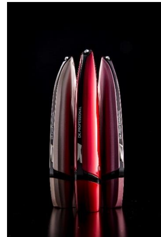
「Beaustage VEGAS Premium」 左から、シャンパンゴールド、イタリアンレッド、ラズベリーピンク