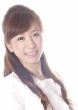
美の伝道師 服部恵氏

全世界でユーザー数が4億人を突破した人気の写真共有SNS「instagram(インスタグラム)」で、謎の美男子として話題となり芸能活動を開始。フォロワー数は85万人を超える。度々有名人のinstagramにも登場するなど幅広い交友関係も注目を集めている。各種テレビ番組に出演、スタイルブック等の書籍の出版やファッションショーへの出演など多方面で活躍。