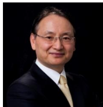
美のプロフェッサー リム・ジョン・ハク氏

独自の美容理論で新たなヘアスタイルとトレンドを次々と生み出すトップヘアスタイリスト。“似合わせの達人”と呼ばれ、モデル、タレント、著名人などからも幅広い支持を集めている。サロンワークのみならず、オリジナルヘアケア商品の開発やテレビ出演、ヘアショー、セミナーなどでその美容技術を世界に発信し続けている。