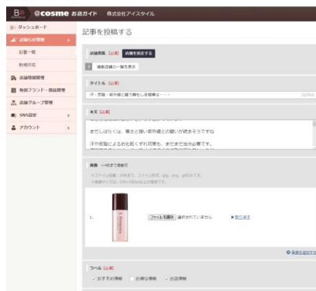
店舗管理画面イメージ