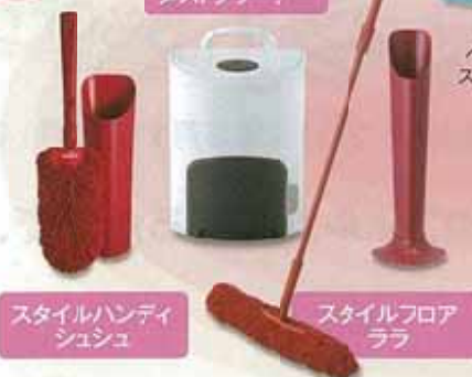
スタイルハンディ シュシュ