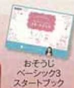
おそうじベーシック3 スタートブック