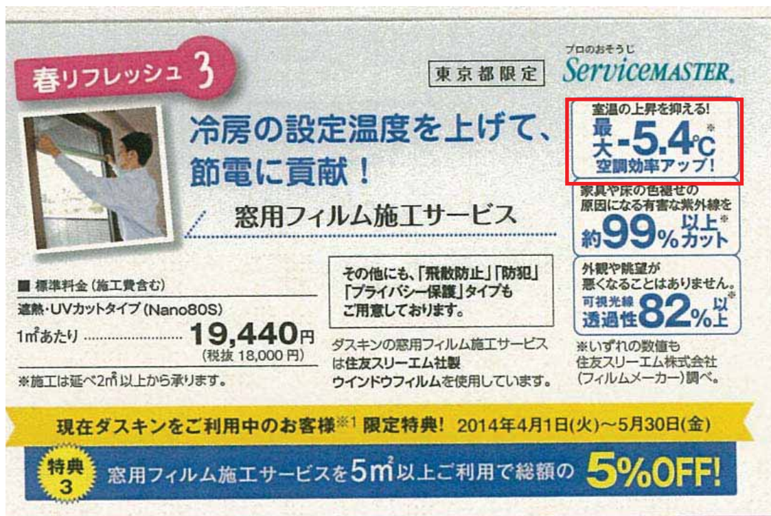
【表示例 1 ダイレクトメール】